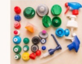
Pulvérisant, doseur et non doseur